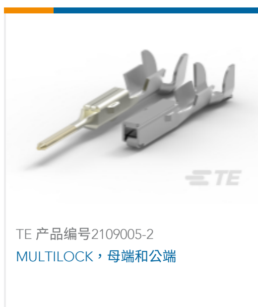
TE 产品编号2109005-2 MULTILOCK, 母端和公端