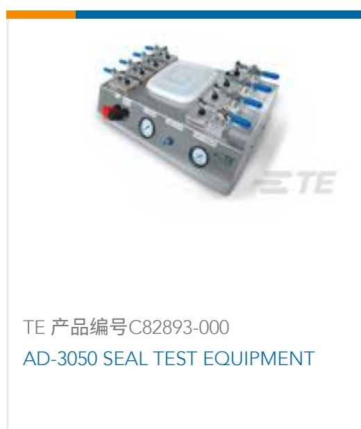
TE 产品编号C82893-000 AD-3050 SEAL TEST EQUIPMENT