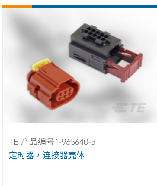
TE 产品编号1-965640-5 定时器, 连接器壳体