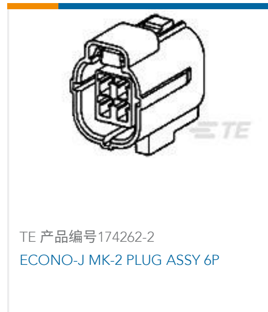
TE 产品编号174262-2 ECONO-J MK-2 PLUG ASSY 6P