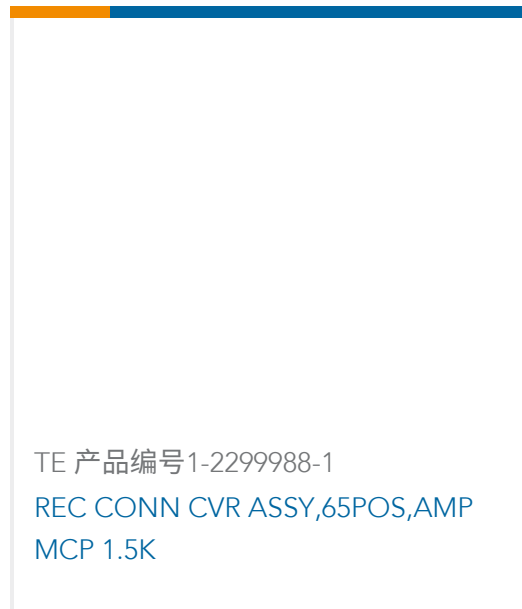
TE 产品编号1-2299988-1 REC CONN CVR ASSY,65POS,AMP MCP 1.5K