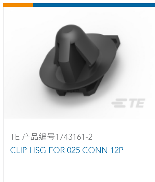
TE 产品编号1743161-2 CLIP HSG FOR 025 CONN 12P