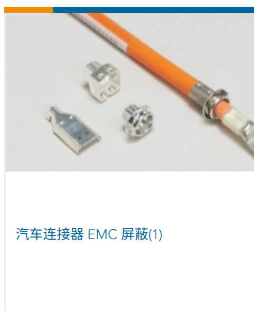
汽车连接器 EMC 屏蔽(1)