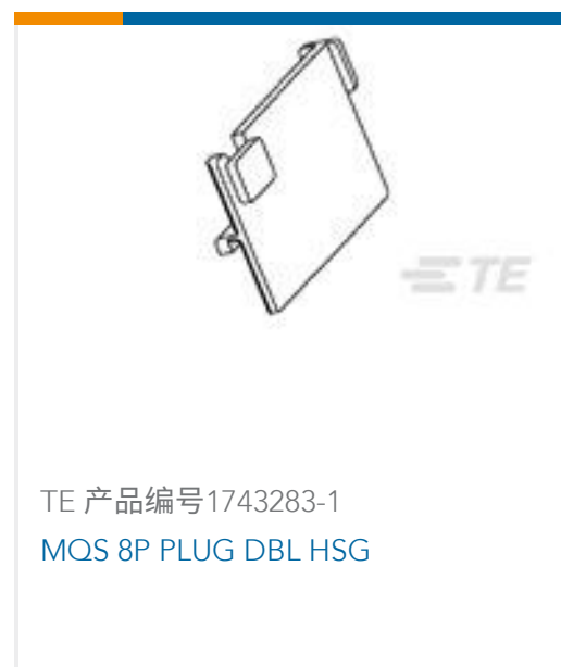
TE 产品编号1743283-1 MQS 8P PLUG DBL HSG