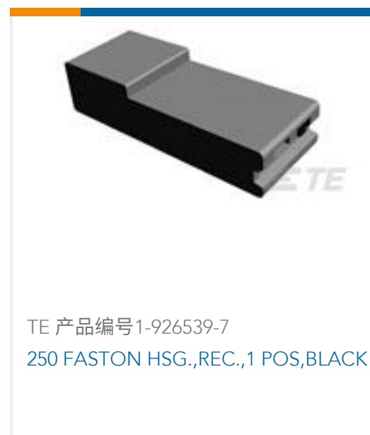
TE 产品编号1-926539-7 250 FASTON HSG.,REC.,1 POS,BLACK