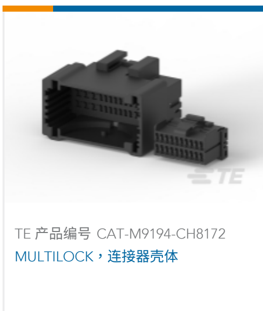
TE 产品编号 CAT-M9194-CH8172 MULTILOCK, 连接器壳体