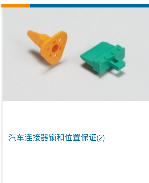
汽车连接器锁和位置保证(2)