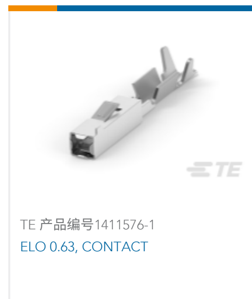
TE 产品编号1411576-1 ELO 0.63, CONTACT