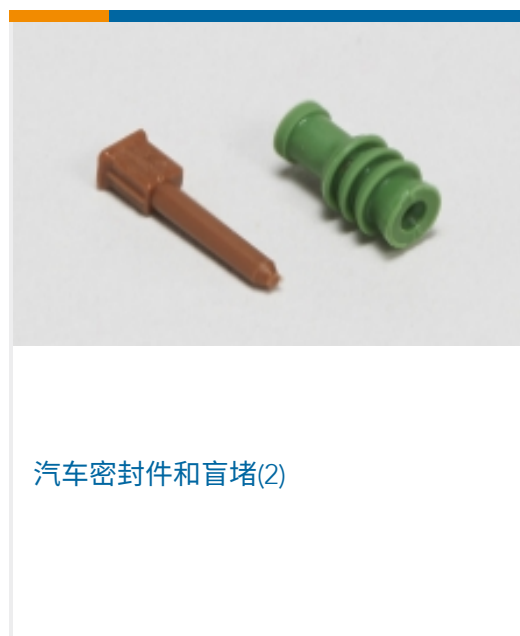
汽车密封件和盲堵(2)