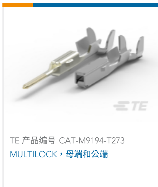
TE 产品编号 CAT-M9194-T273 MULTILOCK, 母端和公端