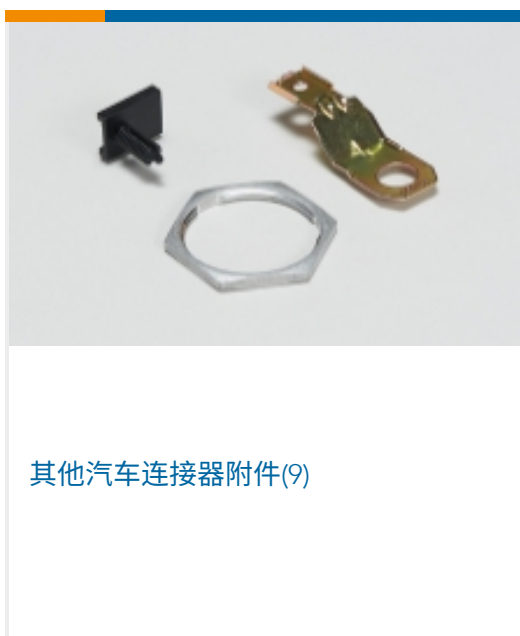
其他汽车连接器附件(9)