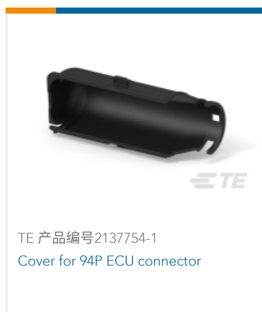
TE 产品编号2137754-1 Cover for 94P ECU connector