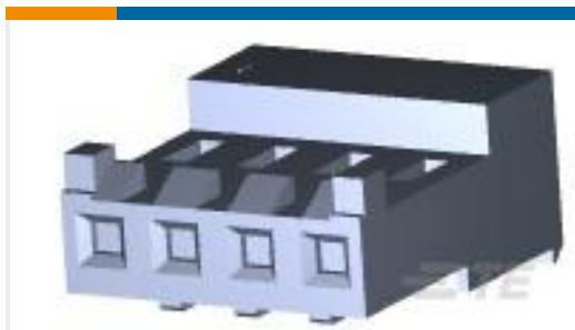
TE 系列/零件编号3-644663-4 04P MTA156 CONN ASSY 20AWG LF