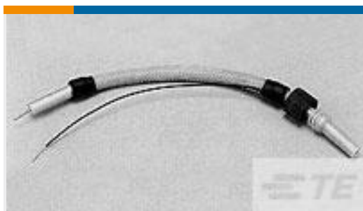
TE 系列/零件编号1-862545-7 LEAD, SGL END ASSY, LGH