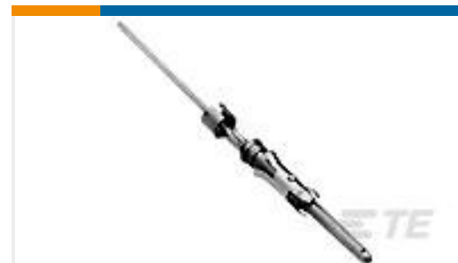
TE 系列/零件编号66471-1 PIN,.062 DIA,.045 SQ POST,LP