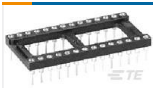
TE 系列/零件编号3-1437538-0 840-AG11D=SOCKET ASSY