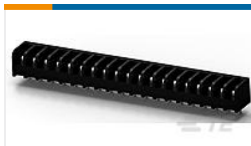
TE 系列/零件编号2-1546011-9 3PCV-05-008=.250 TRI- BARR STRP, SS Screw