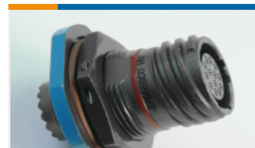
TE 系列/零件编号 YDTS24F17-06PC0000 JAM NUT RECEPTACLE