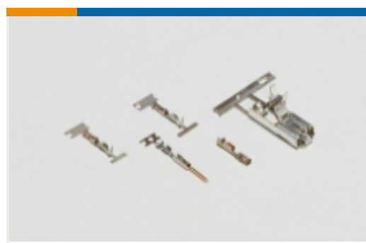
线对板连接器端子(2)