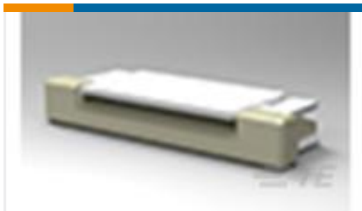
TE 零件编号1-1734839-6 FPC CONN. 0.5MM PITCH T/C,16P