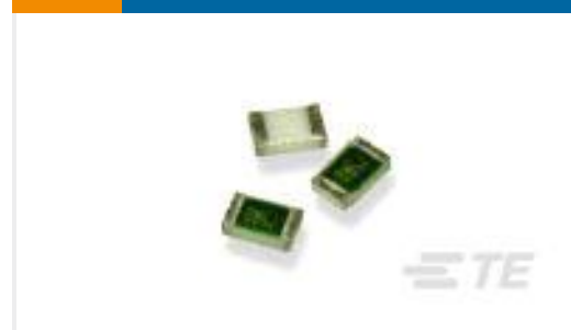
TE 零件编号1879217-6 CPF 0603 220K 0.1% 25PPM 1K RL