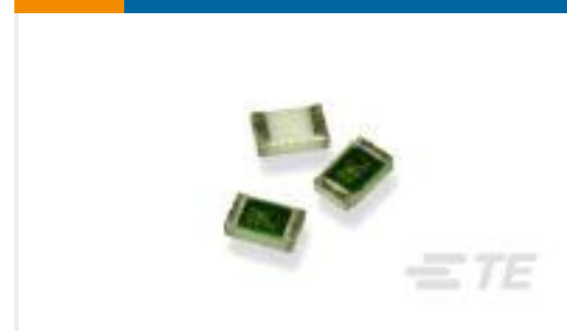
TE 零件编号1879217-9 CPF 0603 300K 0.1% 25PPM 1K RL