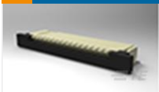
TE 零件编号1-84953-5 1MM FPC HORZ.TOP CONT.ASSY 15P