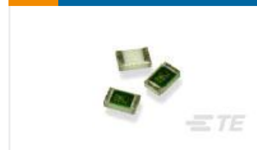
TE 零件编号9-1676481-5 CPF 0603 75K 0.1% 25PPM 1K RL