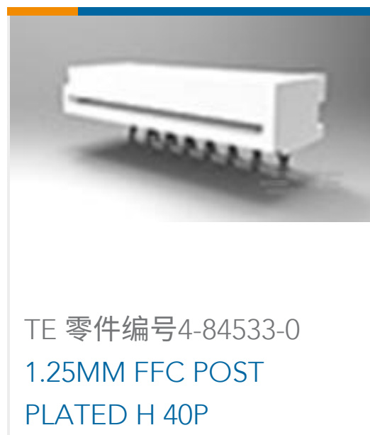
TE 零件编号 4-84533-0 1.25MM FFC POST PLATED H 40P