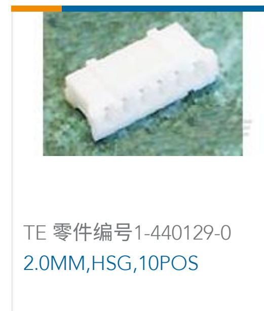
TE 零件编号 1-440129-0 2.0MM,HSG,10POS