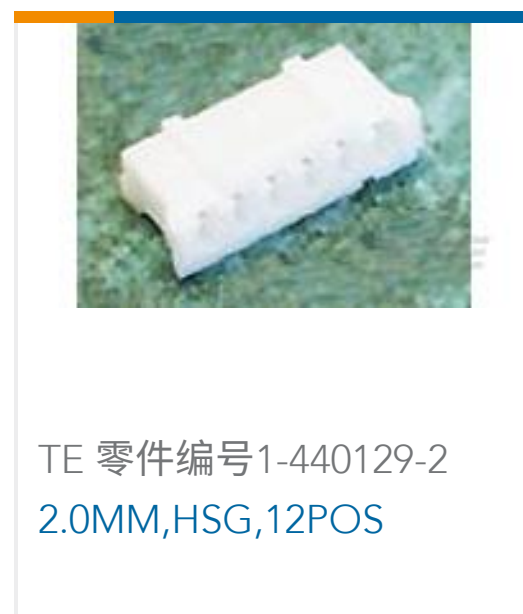
TE 零件编号 1-440129-2 2.0MM,HSG,12POS