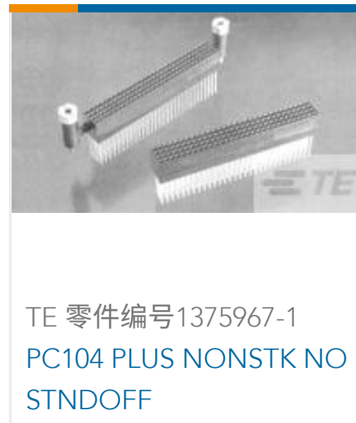
TE 零件编号 1375967-1 PC104 PLUS NONSTK NO STNDOFF