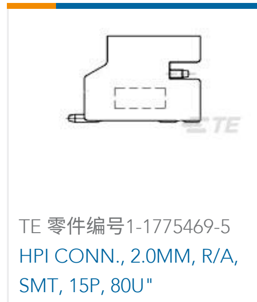
TE 零件编号 1-1775469-5 HPI CONN., 2.0MM, R/A, SMT, 15P, 80U"