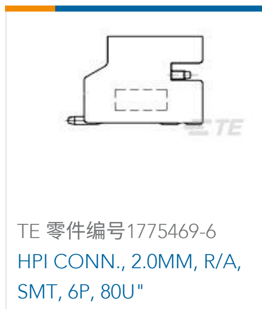
TE 零件编号 1775469-6 HPI CONN., 2.0MM, R/A, SMT, 6P, 80U"