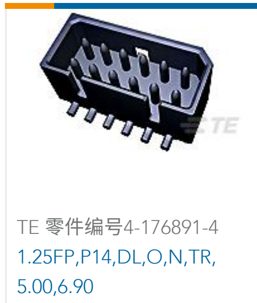
TE 零件编号 4-176891-4 1.25FP,P14,DL,O,N,TR, 5.00,6.90