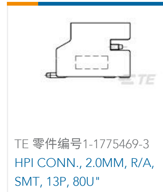
TE 零件编号 1-1775469-3 HPI CONN., 2.0MM, R/A, SMT, 13P, 80U"