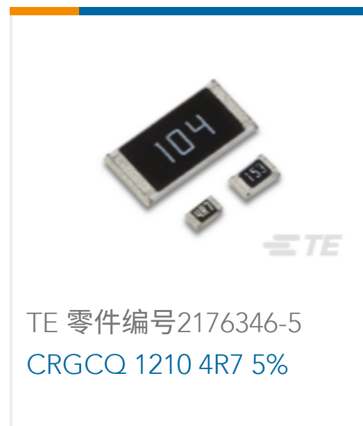
TE 零件编号 2176346-5 CRGCO 1210 4R7 5%