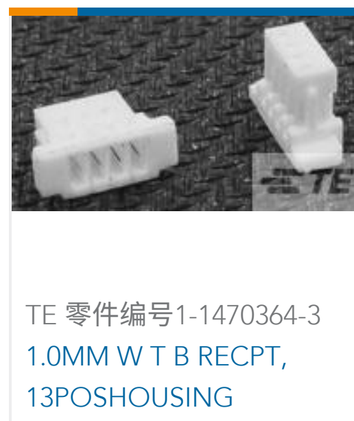
TE 零件编号 1-1470364-3 1.0MM W T B RECPT, 13POSHOUSING